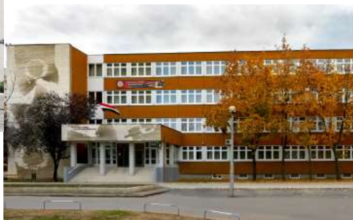
Nyíregyházi Egyetem Eötvös József Gyakorló Általános Iskola és Gimnázium