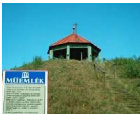
Forrás: http://www.indexkelet.hu/rovatkeret.php?r=22&id_cikk=18 http://kirandulastervezo.hu/celpont/nagykallo/insegdomb