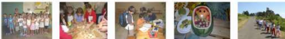
Bentlakásos tábor tematikája