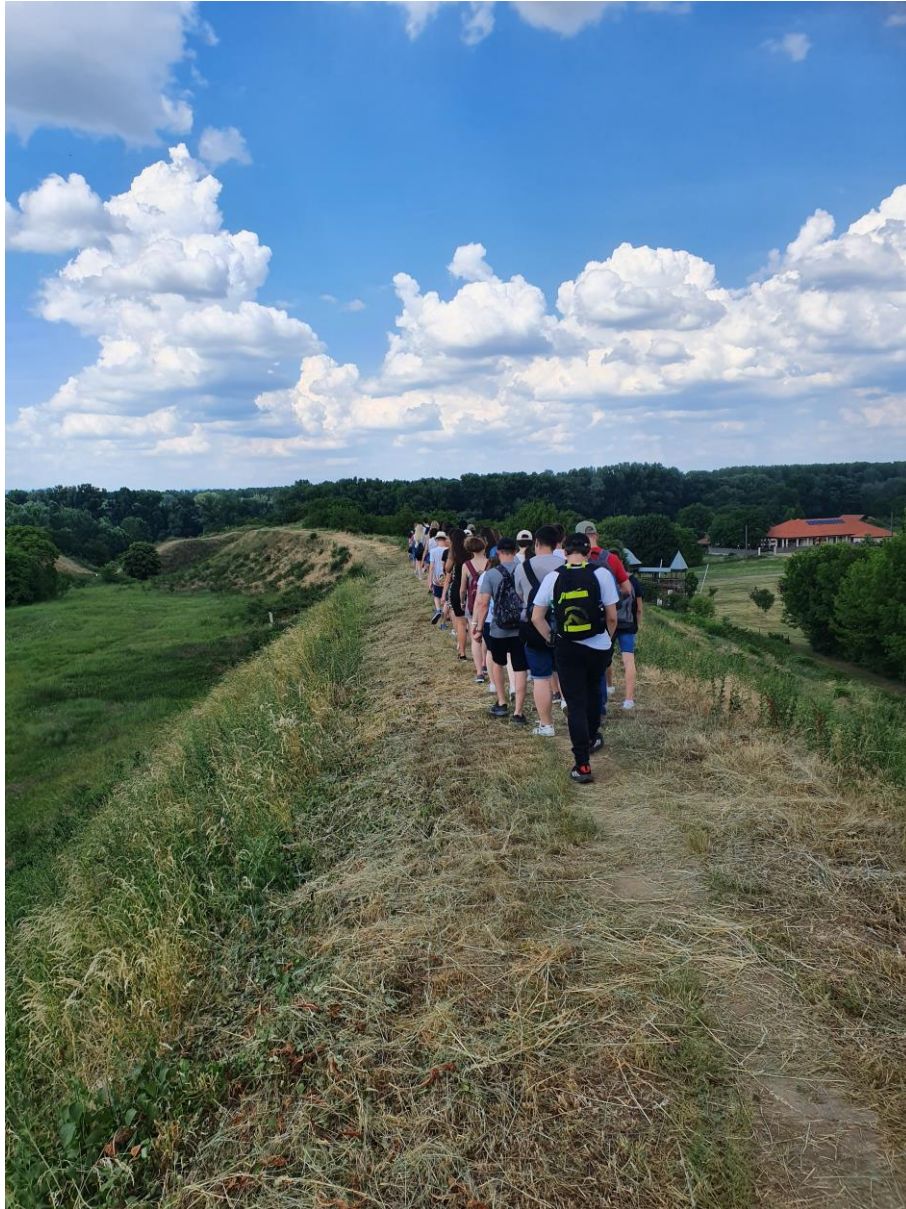
Történelmi körséta a Szabolcsi földvár várfalán