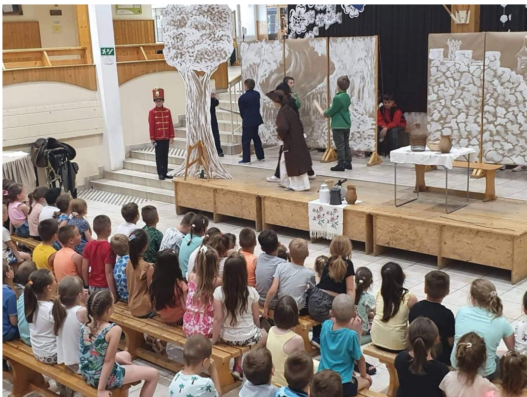
Interaktív mesejáték („Mátyás király Gömörben”)

A harmadik napot a Mátyás király Gömörben c. mesejáték bemutatásával kezdte a csoport. Az Eötvös Gyakorlóiskola alsó tagozatos diákjainak szántuk az előadást, de mivel viszonylag kevés idő volt a felkészülésre, és a csoport tagjaiban is kevés színészi véna csörgedezett, így inkább egy interaktív mesemondás, játék, és beszélgetésnek volt mindez nevezhető, amelynek hangulata viszont igen remekre sikeredett. A napot Debrecenben a református Nagy-templom látogatásával folytatta a csoport, majd a csoport egy részének kívánságára még a Munkácsy trilógia megtekintésével is fűszereztük a programot a Déri Múzeumban, majd a Hortobágyon a korabeli magyar gazdaság fő kivitelének számító élőállat állományok világába tekinthettünk be egy hangulatos lovaskocsizással.