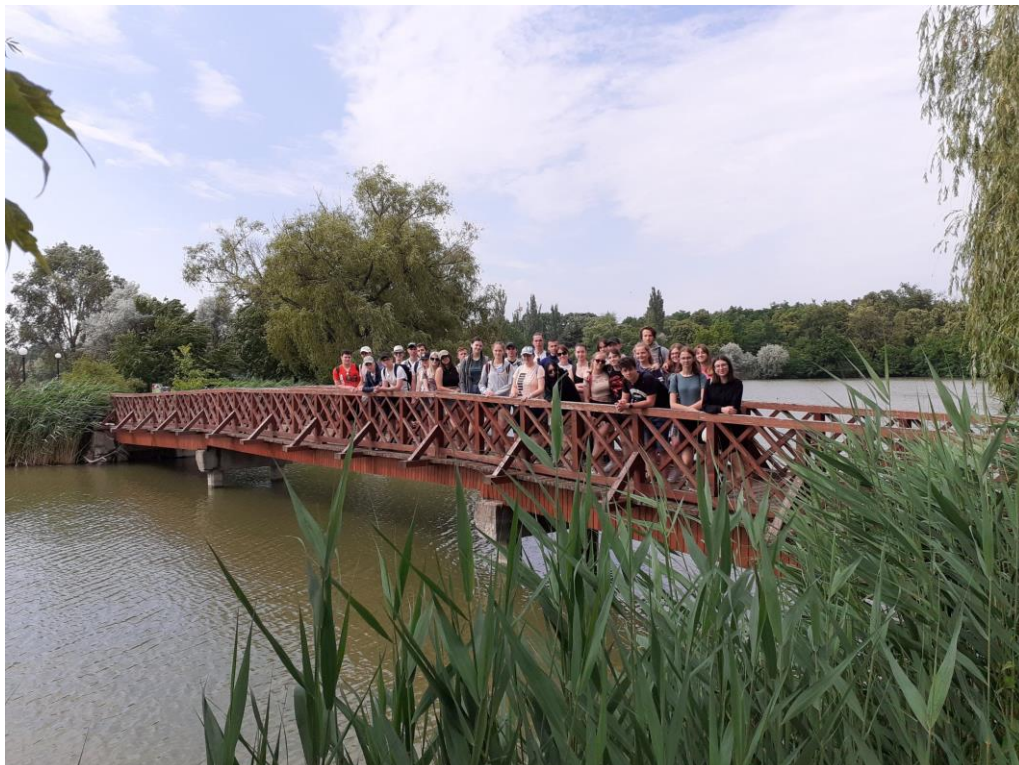
A rimaszombati diákok Nyíregyháza-Sóstón

Az utazás utolsó napját Sóstófürdőn töltötte a csoport. Sóstó természeti környezetének és a Vadaspark egyedülálló állományának megtekintésével, majd elbúcsúzva a nyíregyháziaktól autóbusszukkal hazaindult a csoport.