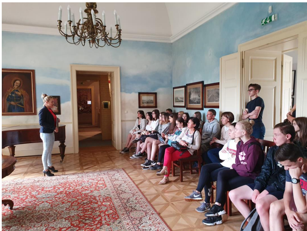
A Madách kastély tárlatvezetőjének érdekes bemutatóját hallgatva

A második napon (némiképp átrendezve az előzetesen tervezett napirendeket) Alsósztrégovára utazott a csoport, ahol a Madách család egykori kastélyában berendezett irodalmi emlékhely meglátogatásával tisztelegtünk Madách Imre és zseniális műve, Az ember tragédiája előtt. A délelőttöt a Kékkői várban töltötte a csoport, és tárlatvezetéssel ismerhette meg a Balassiak fellegvárát. Délután az egykori Magyar Királyság egyik legjelentősebb bányavárosában, Selmecebányán történelmi sétát tettünk a legendás épületek között a romantikus macskaköves utcákban.