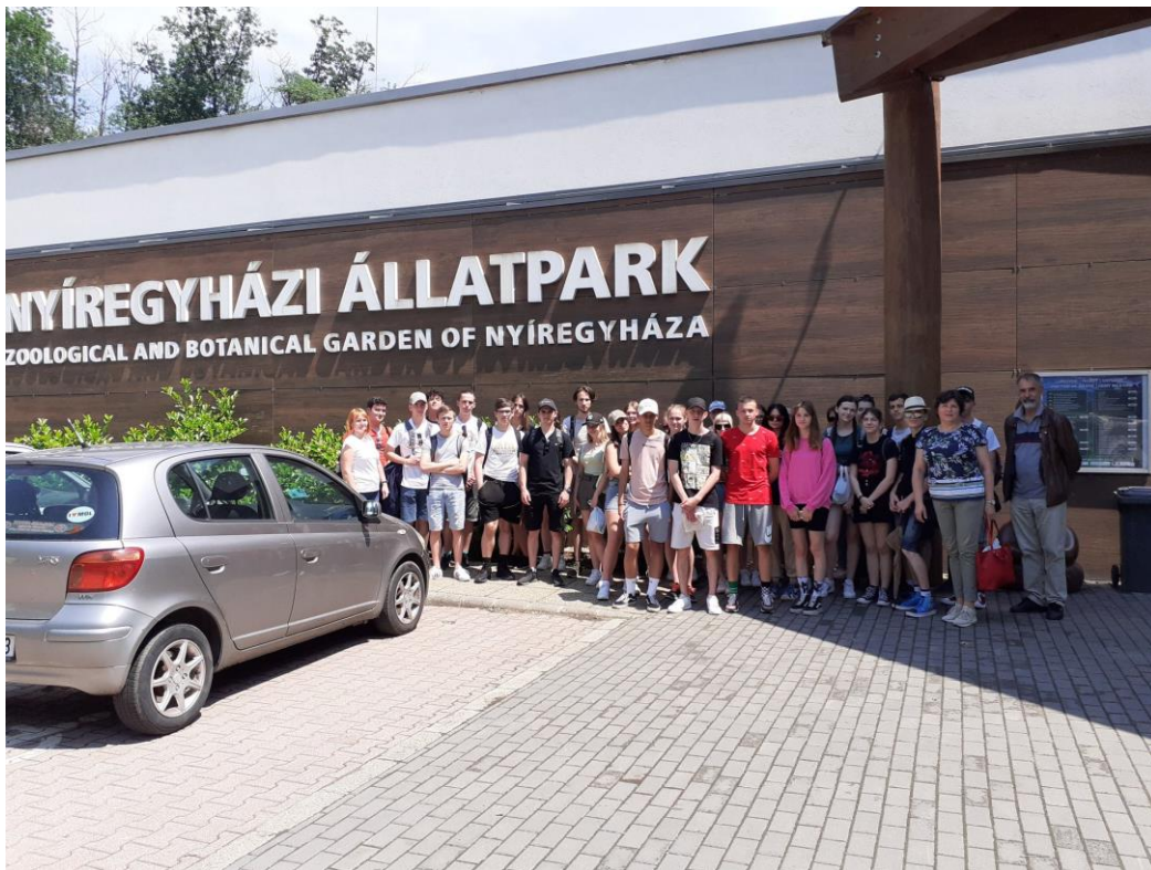
A búcsúzás és az utolsó nyíregyházi csoportkép hazaindulás előtt