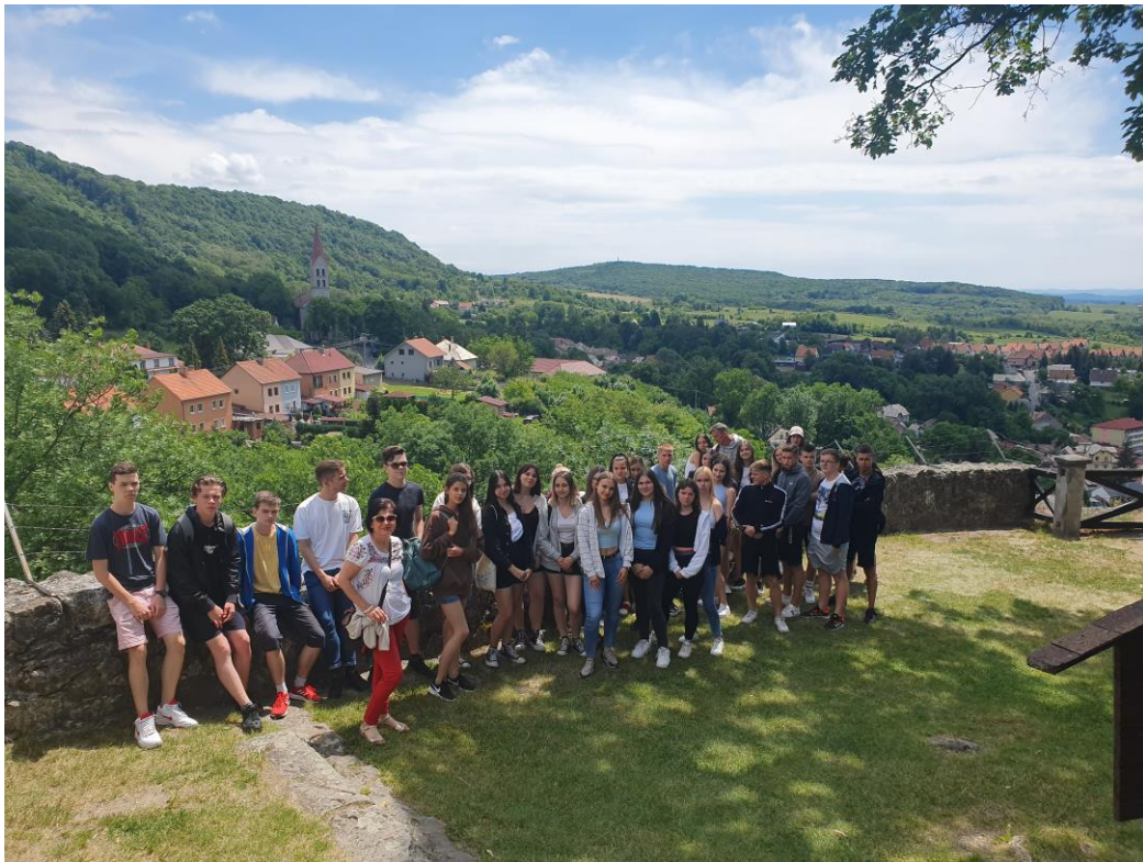
Csoportkép a Kékkői vár teraszán