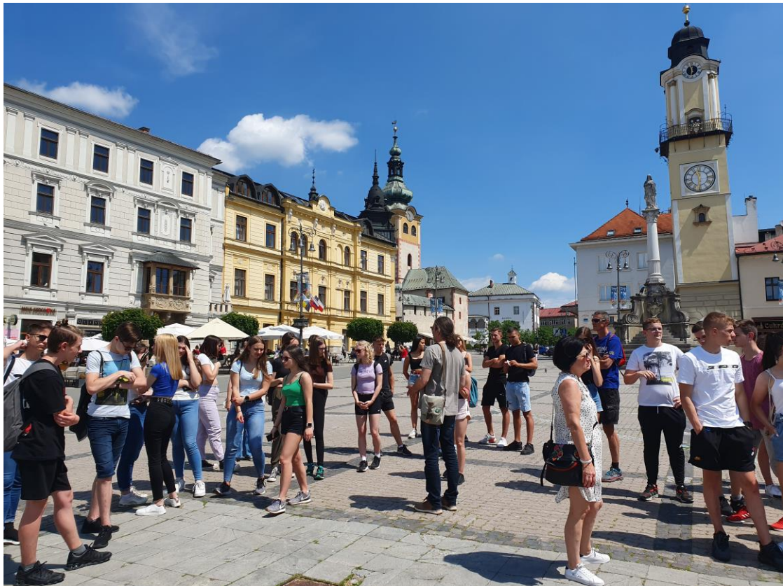
Besztercebánya főterén a szabad program után gyülekezik a csoport