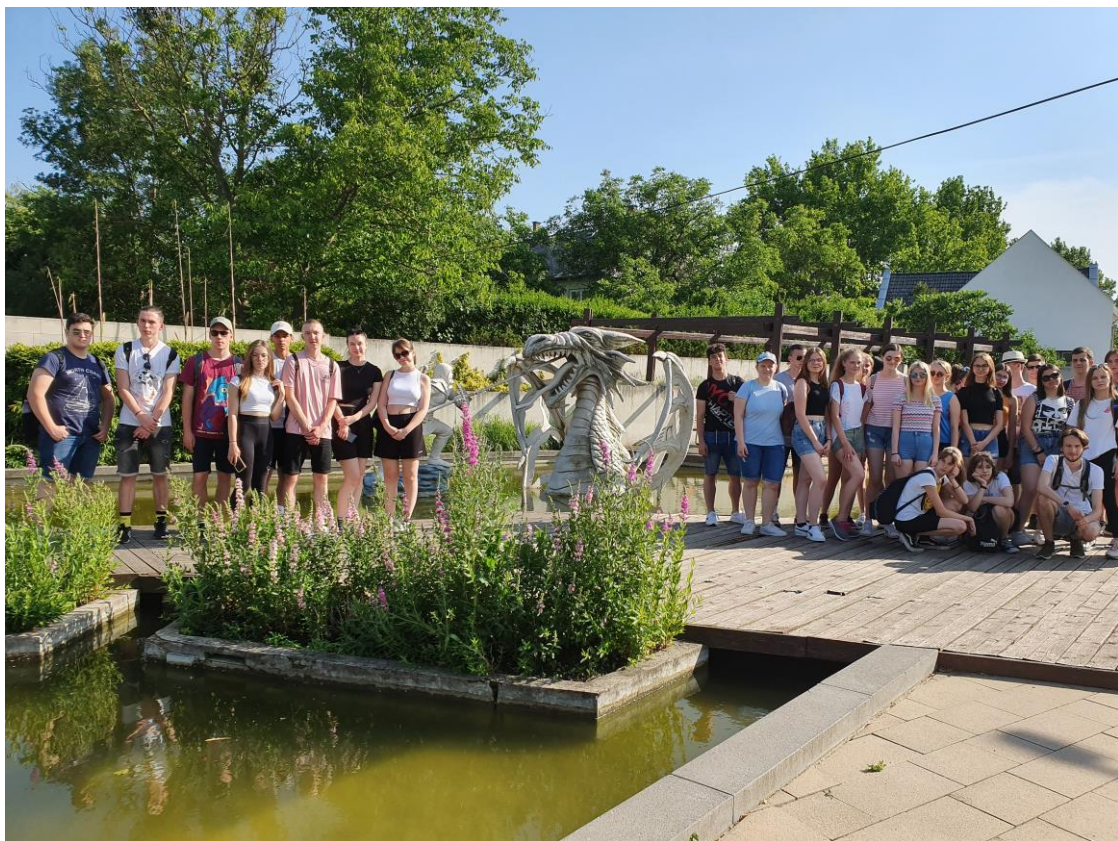
A rimaszonbati diákok Nyírbátorban a Hősök sétányán