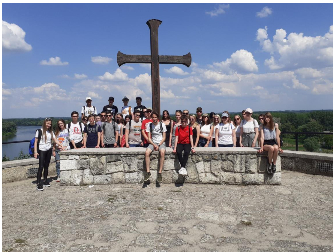
Régi ismerősként köszöntik a nyíregyházi diákok a megérkező felvidéki csoportot