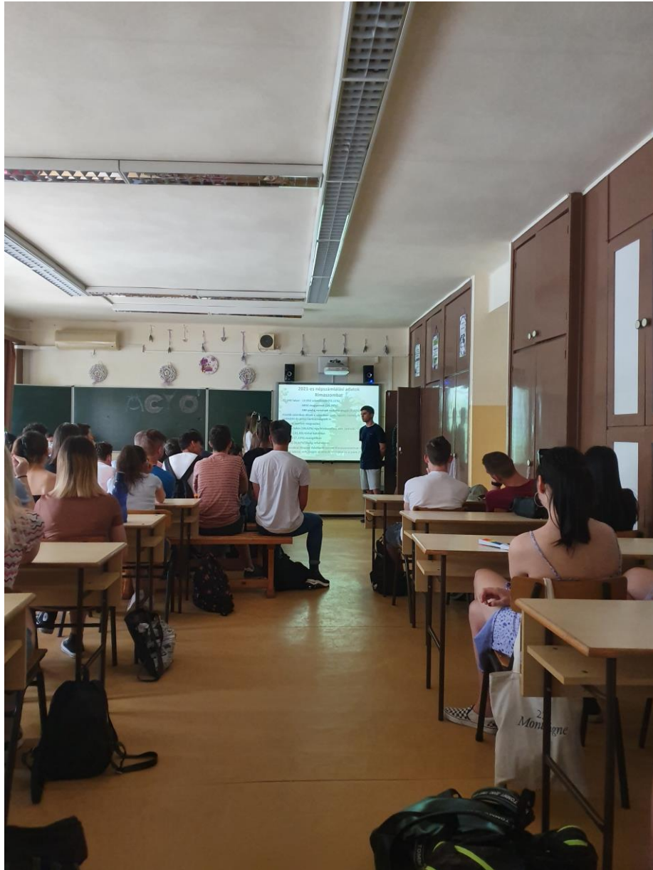
A rimaszombati diákok iskolabemutató előadása