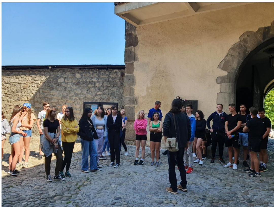
A Zólyomi várat a helyi gimnázium egyik pedagógusa mutatta be a csoportnak

A harmadik nap a királyi várak „ostromáról” szólt. Zólyom várat autóbusszal és könnyű sétával értük el, de Murány várának „meghódítása” komoly túrát igényelt mindannyiunktól. A 930 méter magasból elénk táruló gyönyörű kilátás viszont kárpótolt mindenért. A két vár között Besztercebányát is útba ejtettük a Mátyás-ház megtekintésével és belvárosi szabad programmal.