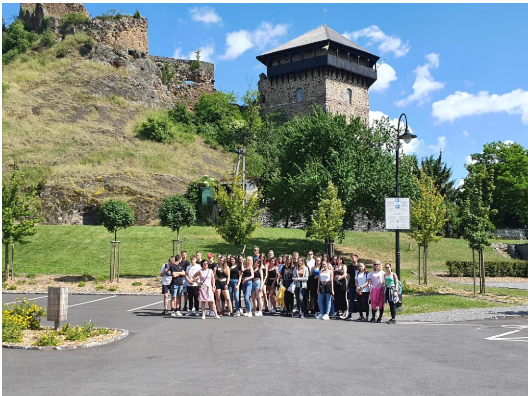
Csoportkép háttérben a Füleki várral