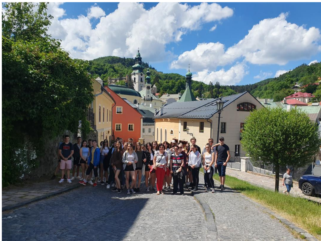
Jellegzetes selmecebányai utcakép és a nyíregyházi csoport