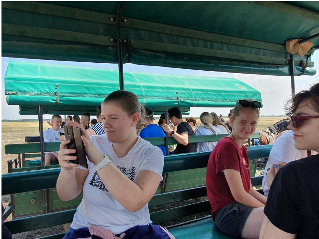
Hortobágyi pusztai fogatozás