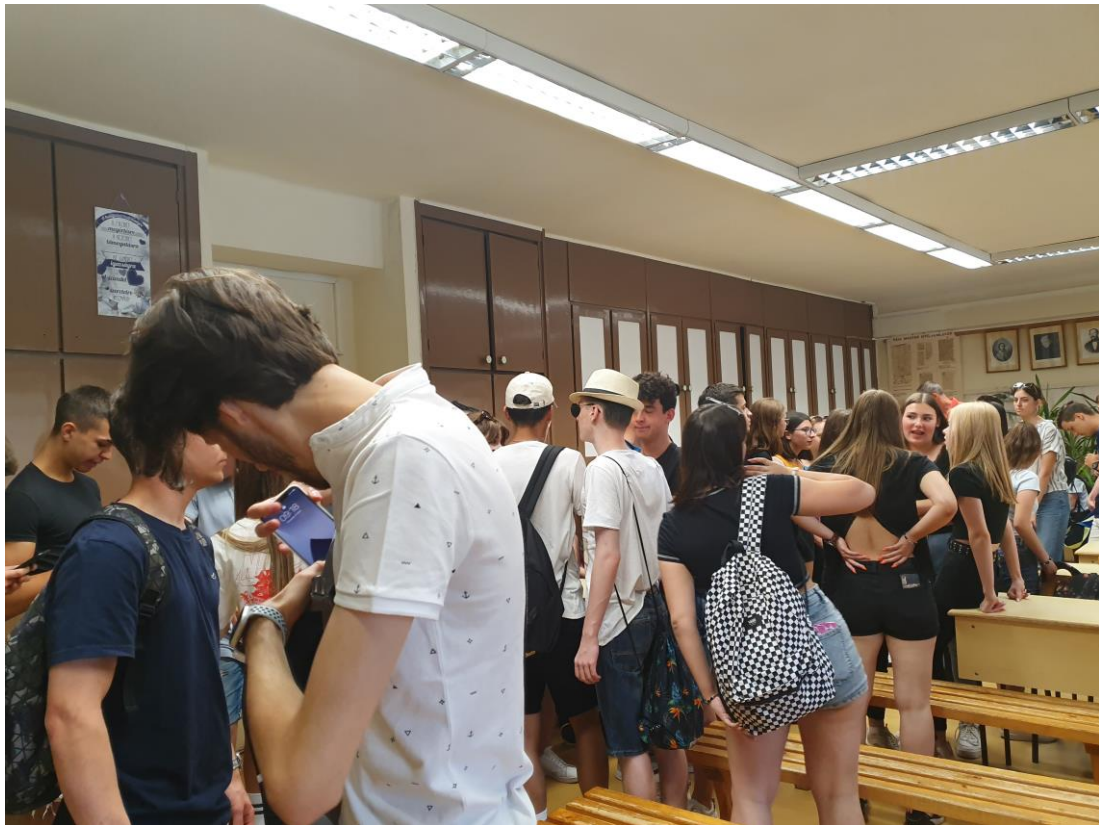
Városnézéshez, szabad programhoz készülődnek a diákok