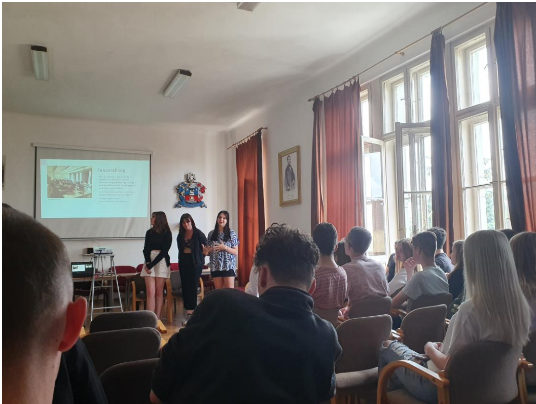
A nyíregyházi diákok diaképes iskola- és városbemutatója