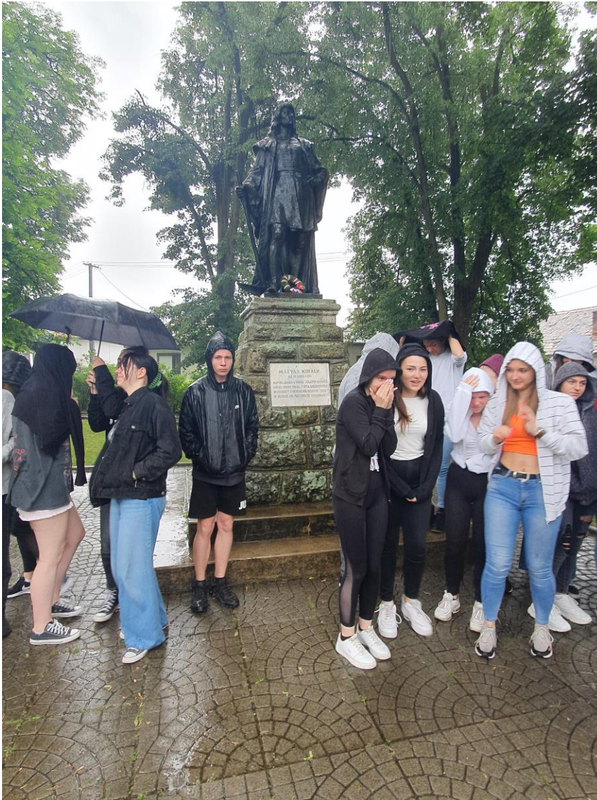
A csoport néhány tagja Mátyás király szobra előtt (Sajógömör)

Az utazás negyedik napján reggeli és az autóbuszunkba történő bepakolás után búcsút vettünk szállásunktól, és a gombaszögi cseppkőbarlang felé vettük utunkat. Közben megálltunk Sajógömörben Mátyás király különleges szobránál, mely egyedülálló módon kapával ábrázolja az uralkodót. A szobor előtt történő fotózással hangolódunk a Mátyás király Gömörben c. mesejáték előadására, és igyekeztünk elvonatkoztatni a szakadó eső okozta körülményektől. A gombaszögi barlangban tett közel egy órás program is érdekes volt, hiszen a barlang a gyönyörű szalmacseppköveiről ismert, s ilyen a Szlovák- és Aggteleki-karszt világa keretében a világ természeti örökségének jegyzékén szerepel. A külhoni utazás utolsó állomásának programtervét jelentősen felülírta az időjárás, hiszen Kassára érve szakadó eső fogadott bennünket, így esernyővel tempósan jártuk be a sétálóutcát és a Szent Erzsébet-székesegyház környékét, majd a helyi vendéglátóknál és bevásárlóközpontokban tett ebéd és bevásárlás után indultunk haza. Nyíregyházára a kora esti órákban érkezett a csoport kicsit fáradtan, de mégis élményekkel telten.