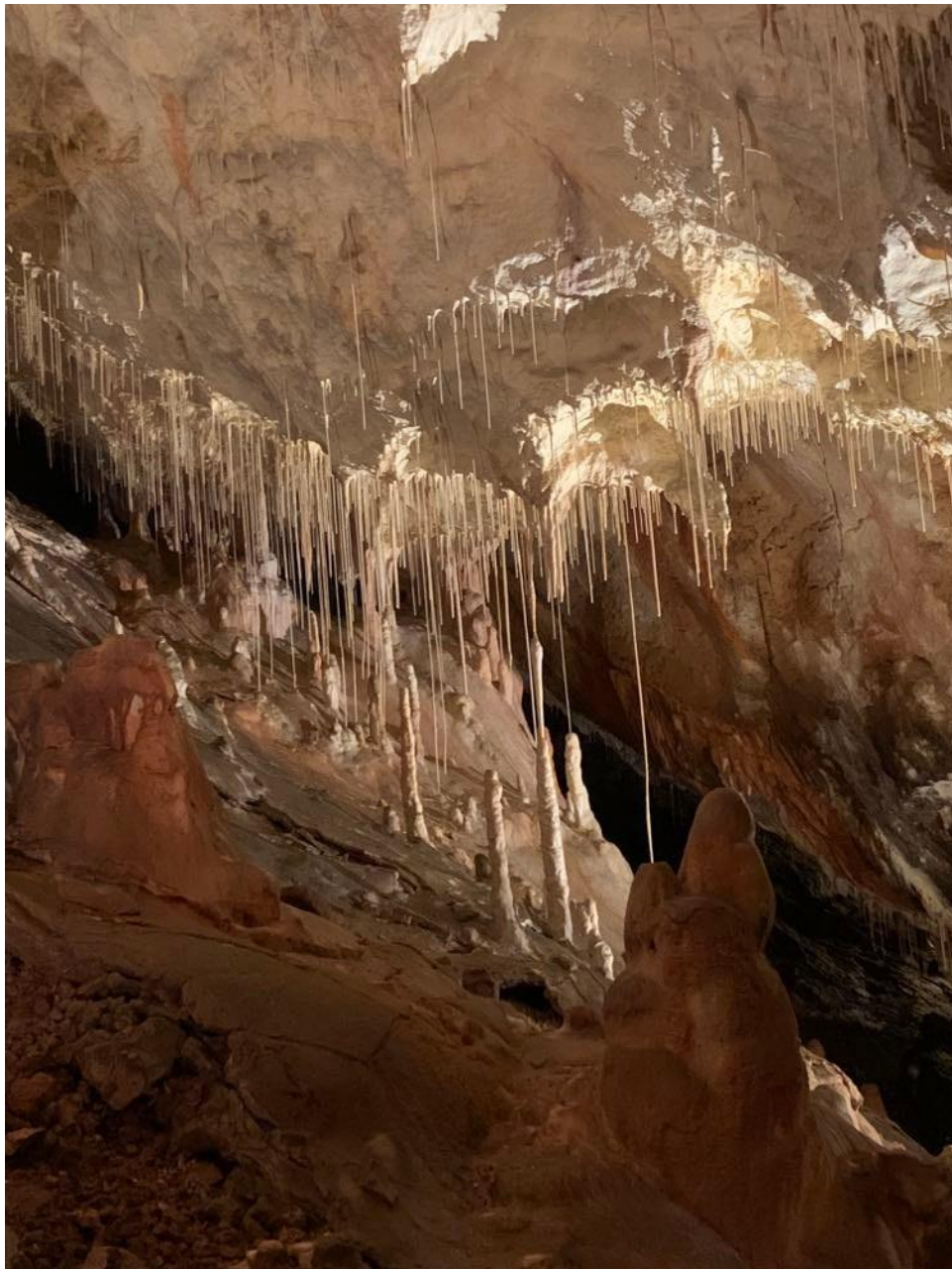
A gombaszögi barlang csodálatos szalmacseppkövei